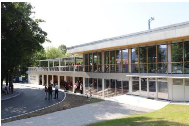
Slika 2 Realizirana investicija v prvo fazo kopališča Radovljica

Vir: zaključni račun proračuna 2023 (obrazložitev).