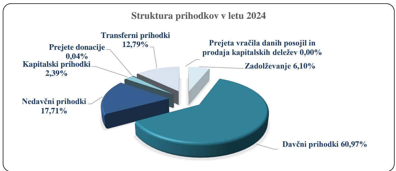
Slika 1: Struktura prihodkov v letu 2024